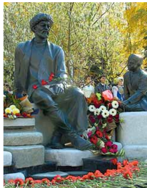
ПАМЯТНИК МИФТАХЕТДИНУ АКМУЛЛЕ СТАЛ СИМВОЛОМ БАШКИРСКОГО ПЕДАГОГИЧЕСКОГО УНИВЕРСИТЕТА.