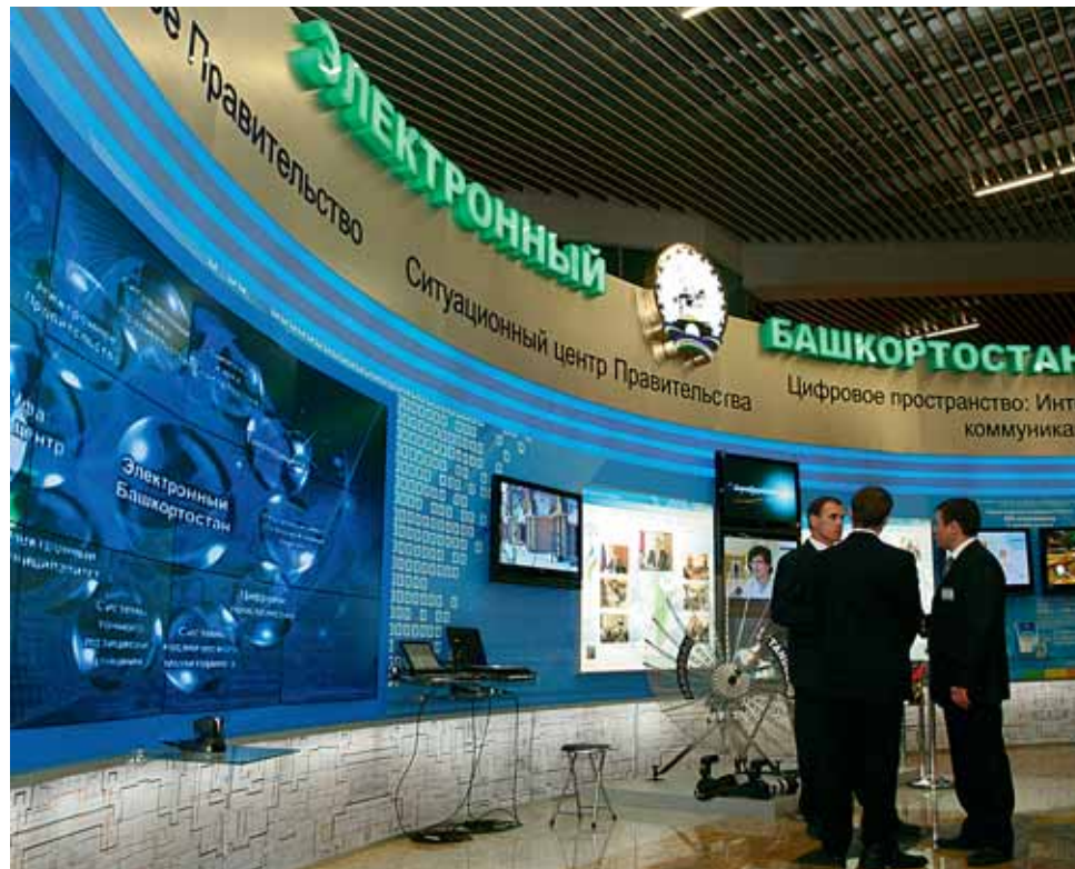
ИНФОРМАЦИОННО-ОБРАЗОВАТЕЛЬНЫЙ ПОРТАЛ ПОМОГАЕТ ПЕДАГОГАМ РЕГИОНА СОВЕРШЕНСТВОВАТЬСЯ И ОБМЕНИВАТЬСЯ ОПЫТОМ.

Наиболее продвинутые учителя сразу оценили виртуальный инструмент общения и попросили разработчиков расширить диапазон возможностей. В ответ получили так называемую стену для сообщений, где поначалу находили однокурсников и земляков, а потом стали обсуждать и профессиональные темы. Портал выявил наиболее активные районы — это, прежде всего, Альшеевский, Стерлитамакский и Туймазинский. По инициативе пользователей вскоре появятся еще два новых модуля — «Школьный музей» и «Творчество учителя», а также комментарии к учебно-методическим материалам.