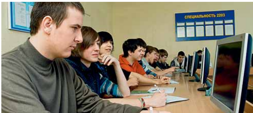
СОВРЕМЕННЫЕ МЕТОДИКИ ОБУЧЕНИЯ ПОЗВОЛЯЮТ КОЛЛЕДЖУ ГОТОВИТЬ ОТЛИЧНЫХ СПЕЦИАЛИСТОВ.

Св-во о гос. аккред. №0052 серия АА 000052 от 20.03.2006г.