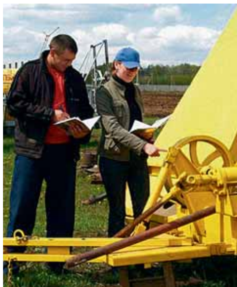
ПРОИЗВОДСТВЕННАЯ ПРАКТИКА — НЕОТЪЕМЛЕМАЯ ЧАСТЬ ОБУЧЕНИЯ СТУДЕНТОВ В АГРАРНОМ ВУЗЕ.

Лицензия серия А №169457 от 26.09.2005г. Свидетельство о гос. аккредитации №0489 от 06.03.2007г.