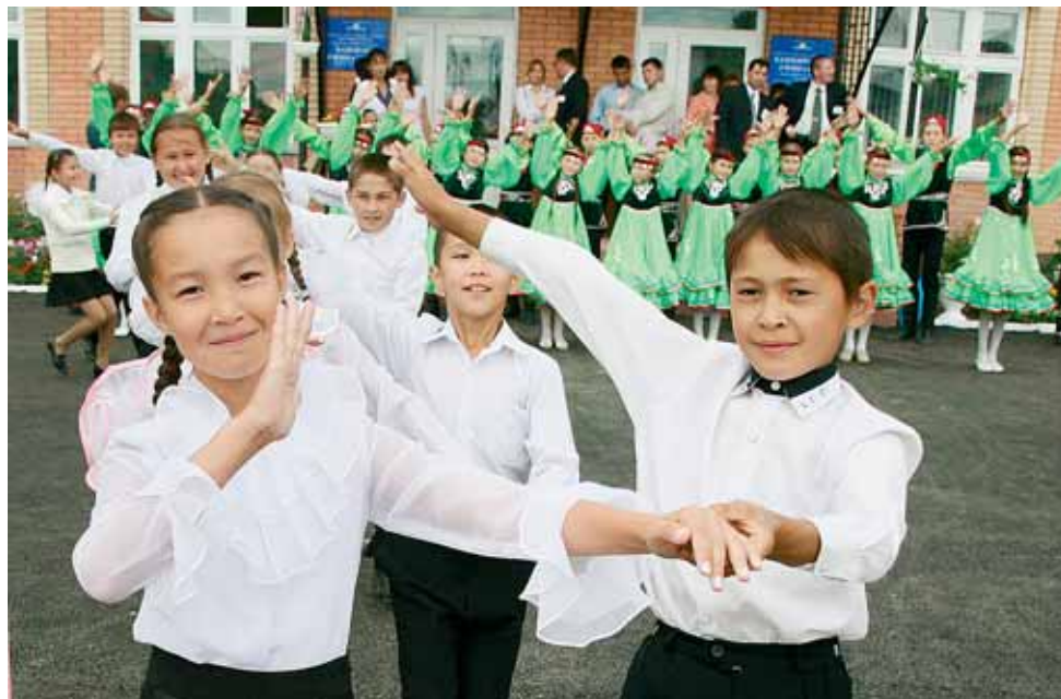
ОТКРЫТИЕ КАЖДОЙ НОВОЙ ШКОЛЫ ПРЕВРАЩАЕТСЯ В ПРАЗДНИК.

Нет, в этом святом деле проволочек не должно быть. В республике функционируют 37 специальных (коррекционных) школ-интернатов, школ, начальных школ-детских садов восьми видов для учащихся с разными нарушениями развития. Сохраняется сеть коррекционных классов в общеобразовательных школах. Для детей, не имеющих возможности по состоянию здоровья посещать школу, организовано обучение на дому. Кроме того, в рамках национального проекта «Образование» проводится большая работа по организации новой формы работы с детьми-инвалидами — дистанционного обучения. Из федерального бюджета и из бюджета республики выделены средства на приобретение комплектов оборудования и подключение его к сети Интернет, на методическую поддержку и создание первой республиканской школы, организующей обучение детей-инвалидов на дому.