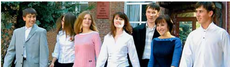
ВЫПУСКНИКИ АКАДЕМИИ В ДЕЛЕ ПРОЯВЛЯЮТ СЕБЯ КАК ХОРОШИЕ СПЕЦИАЛИСТЫ.