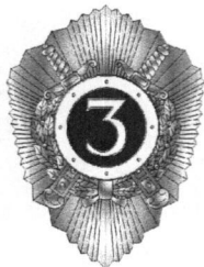
Специалист третьего класса