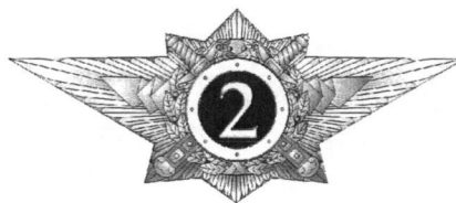
Специалист второго класса