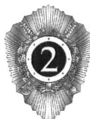
Специалист второго класса